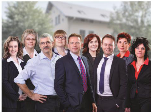
Sichtbare Kompetenz! Ihr Team der JRB. Finanz AG

Selbstverständlich vertreten wir Ihre Interessen in allen Versicherungs- und Finanzangelegenheiten ganzheitlich, unabhängig und objektiv.